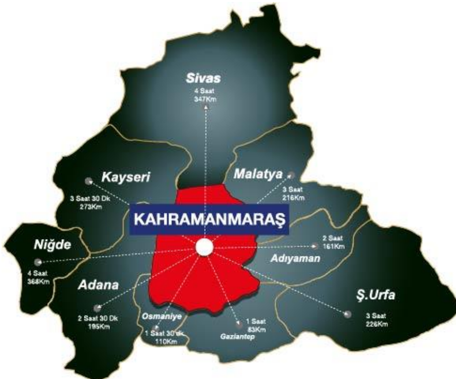
Şekil 2. Kahramanmaraş'ın Komşu İllerine Mesafeleri