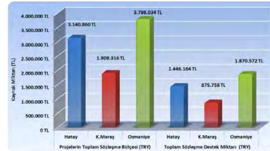
Grafik 2- 2011 yılı TSA Mali Destek Programı İllere Göre Bütçe Dağılımları

Not: Fesh edilen ve imzalanmayan projeler grafiğe dahil edilmemiştir.