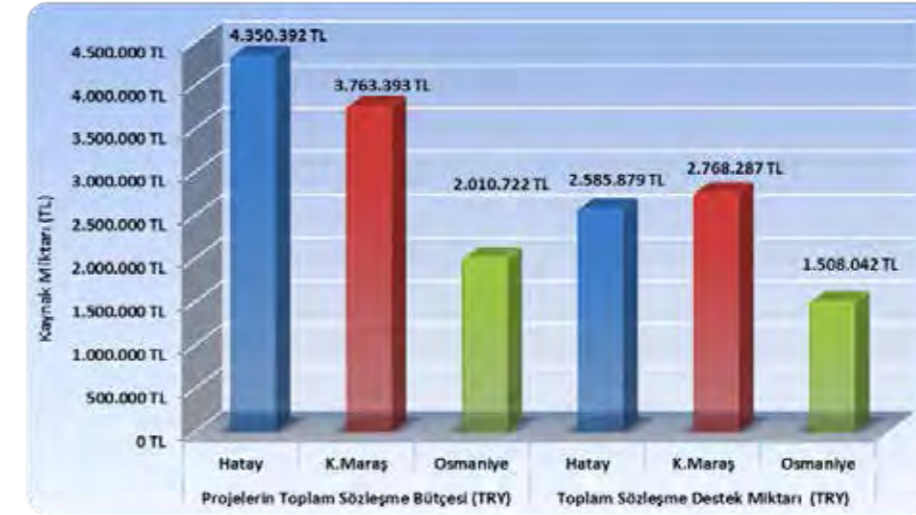
Grafik 1- 2011 yılı TRZM Mali Destek Programı İllere Göre Bütçe Dağılımları

Not: Fesh edilen ve imzalanmayan projeler grafiğe dahil edilmemiştir.